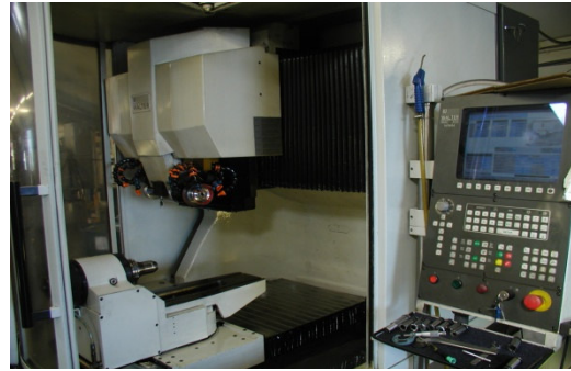
CNC - Walter Værktøjssliber

Nyfremstilling & opslibning af skærende værktøjer