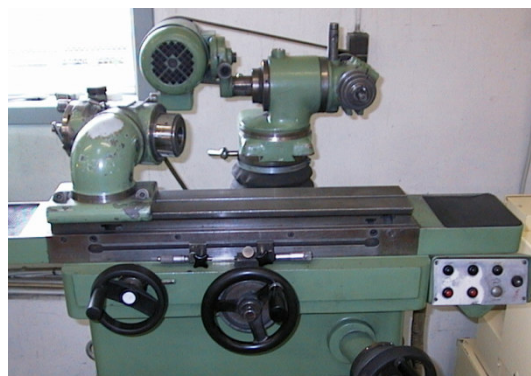
Jungner universal slibemaskine

Nyfremstilling & opslibning af HSS Metalklinger