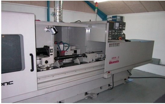
CNC – Rundsliber OKAMOTO