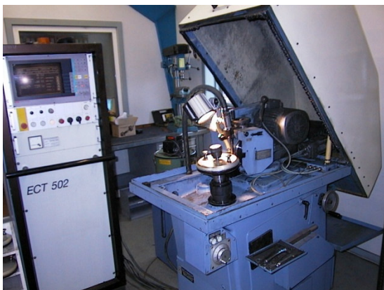
CNC - HSS Klingesliber

Nyfremstilling & opslibning af HSS Metalklinger